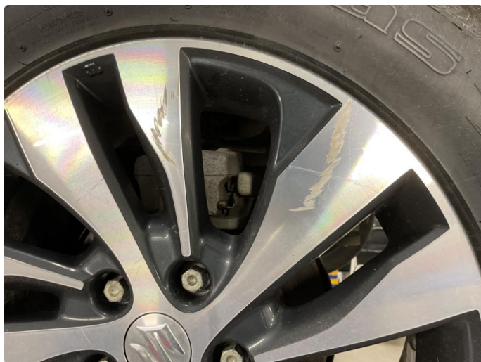
1.4 Skade på felg