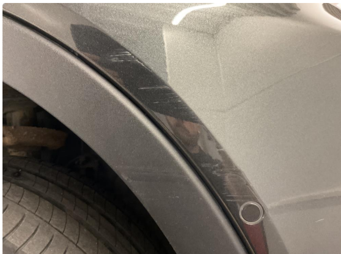
2.3 Ripe(r) ned til grunning