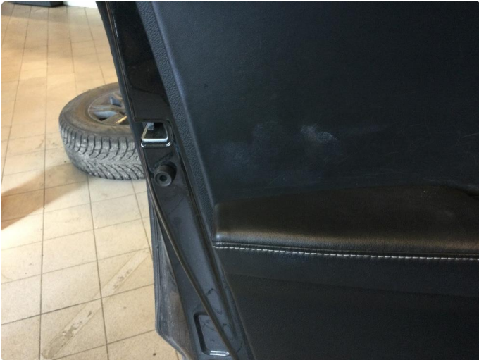
2.1 Øvrige feil