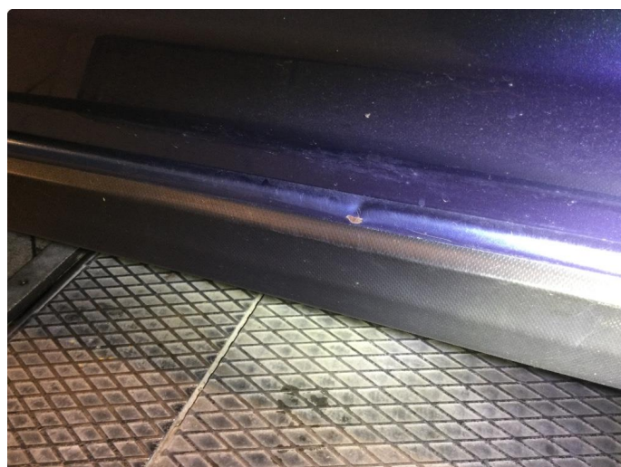
1.6 Liten bulk kanal