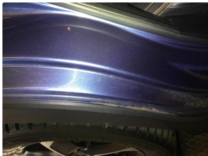
1.2 Innsteg bak