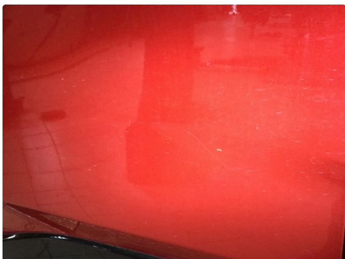
1.2 Noen riper og småbulker