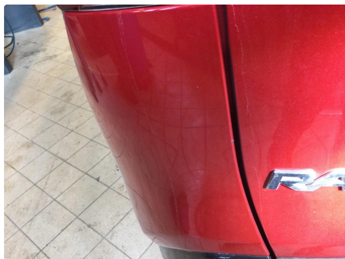
1.2 Noen riper og småbulker