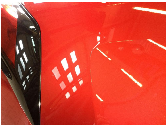
1.2 Noen riper og småbulker