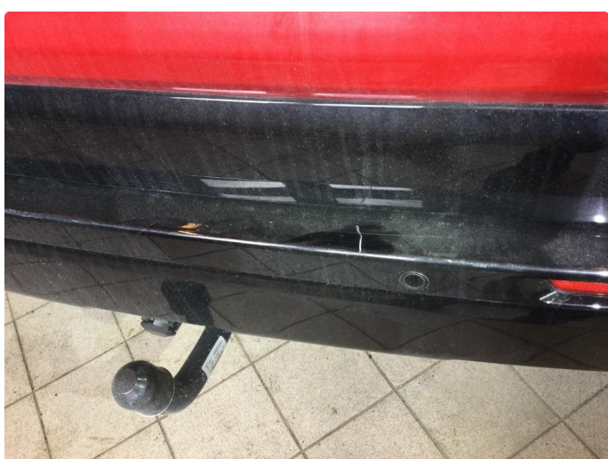
1.2 Noen riper og småbulker