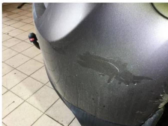
1.1 Generelt bruksslitasje