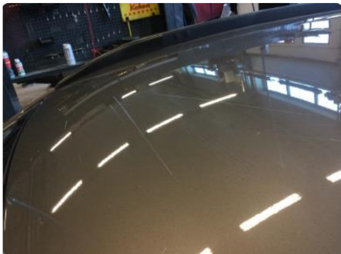
1.1 Generelt bruksslitasje