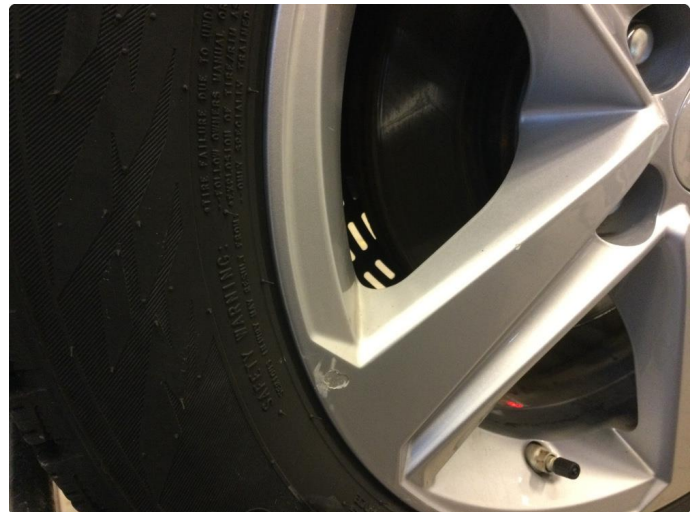
1.4 Skade på felg