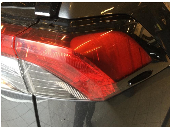
2.1 Noe dugg