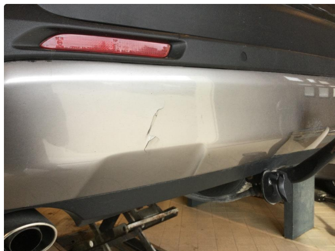
1.3 Liten skade