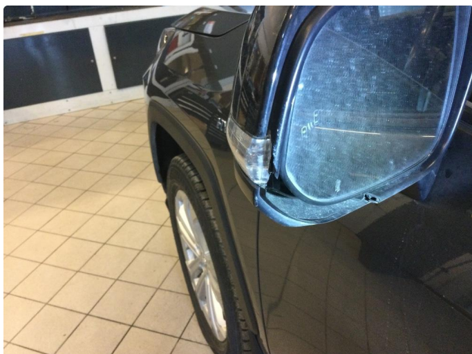
1.1 Speilhus har en liten skade