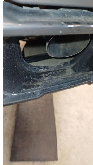
1.1 Lakk flasser