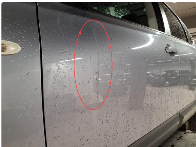
1.1 Noen riper