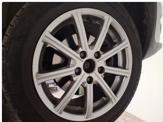
2.1 Hjul kapsel mangler