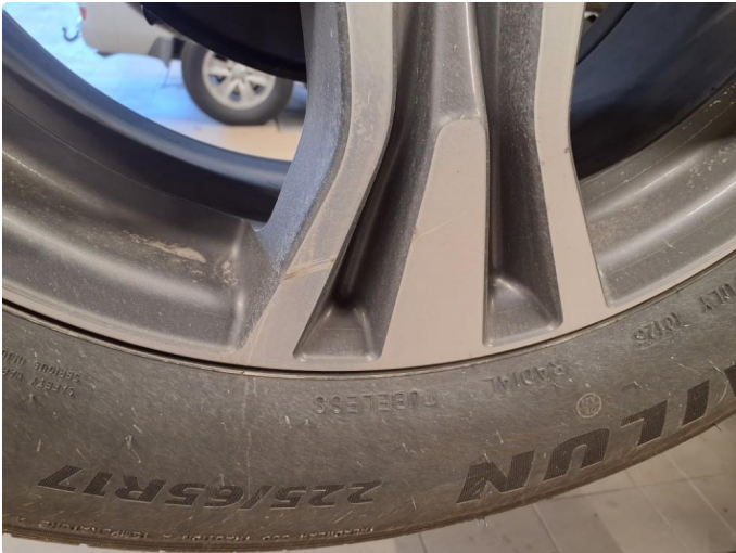
1.3 Kantkjørt felg som har begynt å korrodere. Kosmetisk