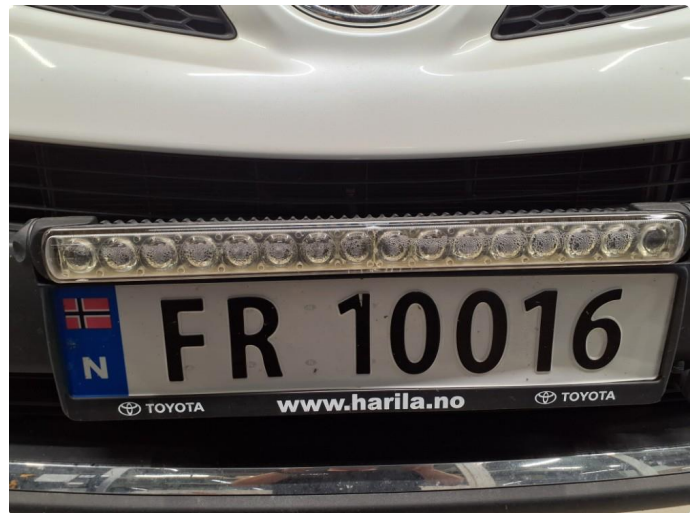
2.1 Dugg/fukt i ekstralys