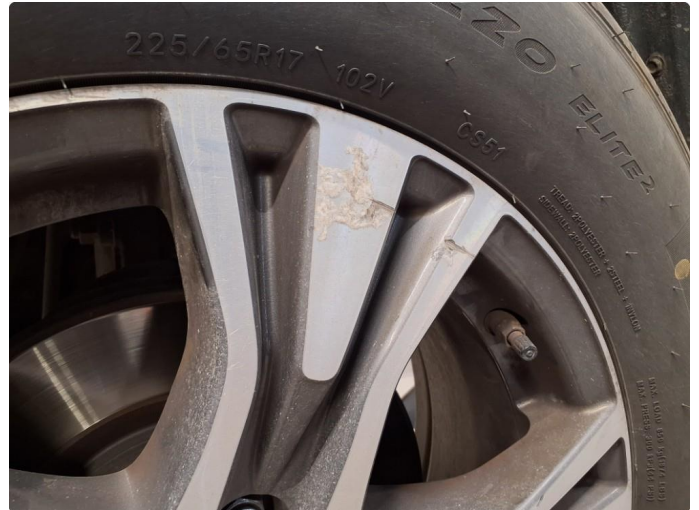
1.3 Kantkjørt felg som har begynt å korrodere. Kosmetisk