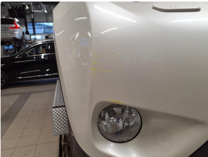
1.4 Ripper finnes på støtfanger her, dette er polert opp og gulfargen er helt borte.