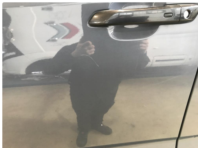
1.2 Ripe ned til grunning