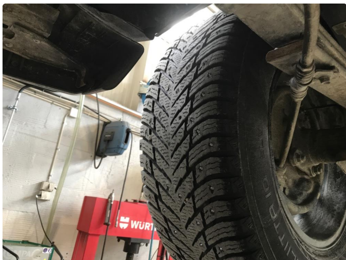
1.5 Piggdekk mangler pigger