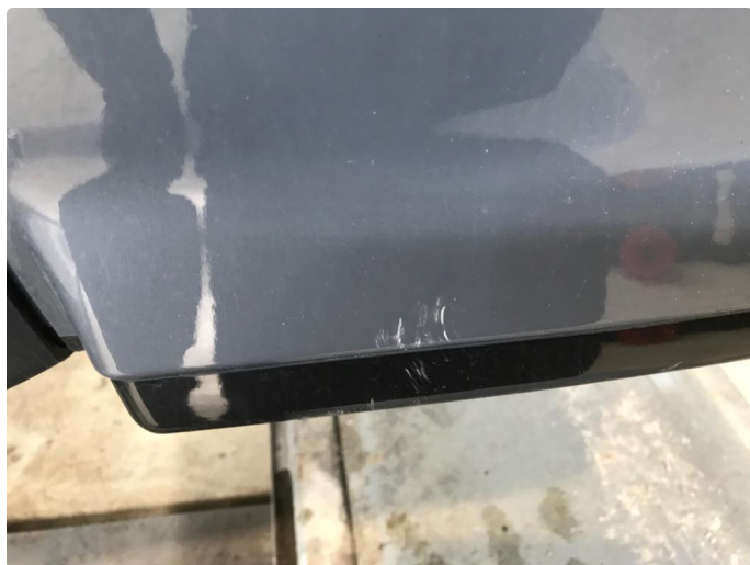
1.6 Ripe(r) ned til grunning