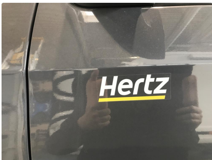
4.1 Fjerne dekor/logo