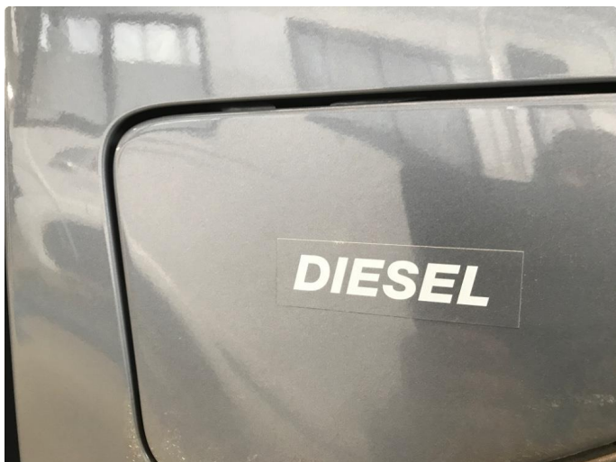
4.1 Fjerne dekor/logo