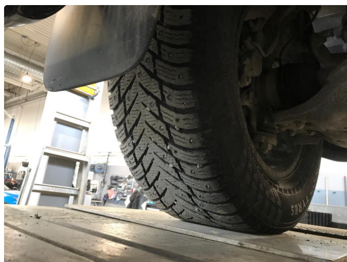
1.5 Piggdekk mangler pigger