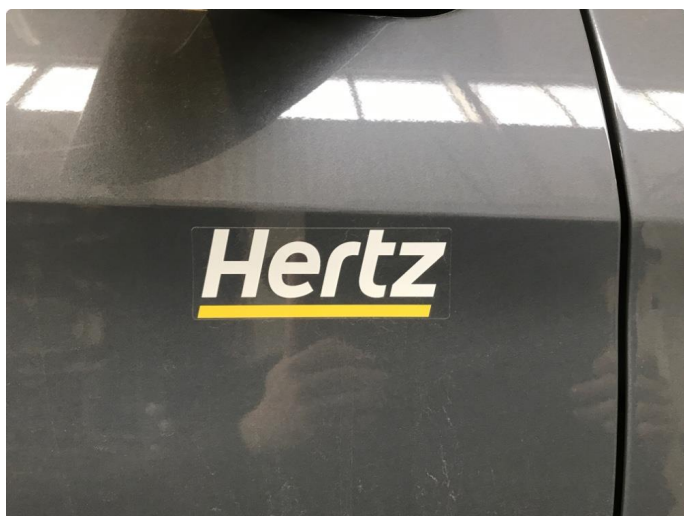
4.1 Fjerne dekor/logo