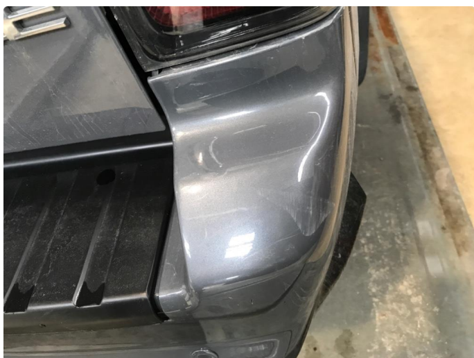
1.6 Ripe(r) ned til grunning