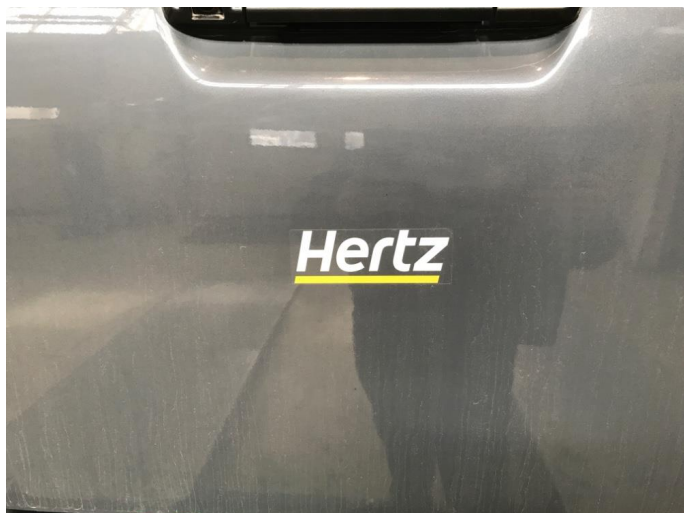
4.1 Fjerne dekor/logo