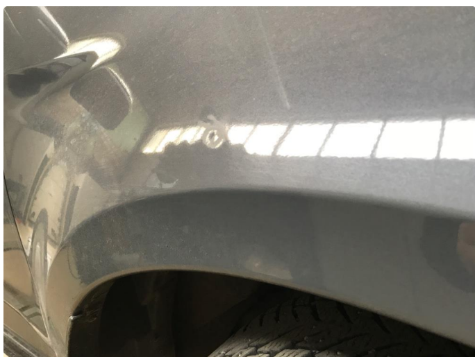
1.3 Bulk med lakkskade