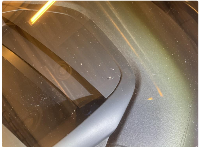
1.1 Noe små steinspur i frontrute. Fremstår som normal slitasje iht km.stand