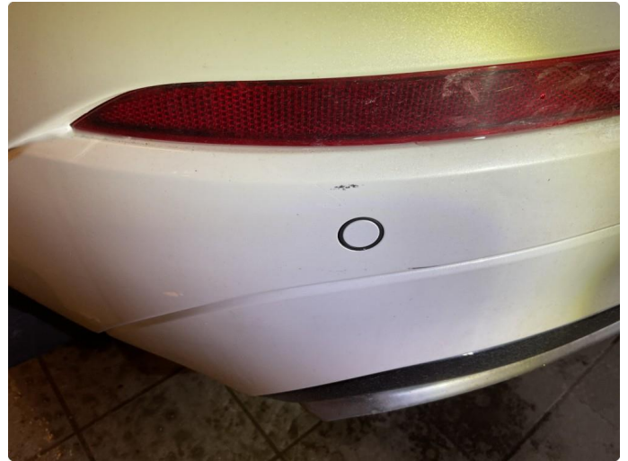
1.1 Lite merke på støtfanger bak