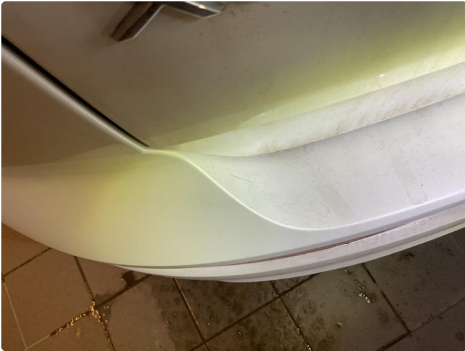
1.1 Lite merke på støtfanger bak