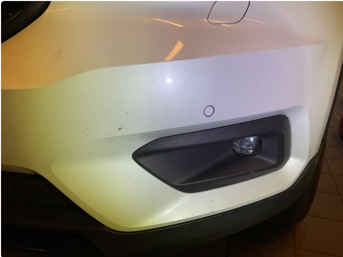
1.1 Noe små steinsprut frontfanger