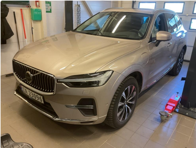
1.1 Generelt noe bruksmerker rundt om bilen. Fremstår som normal slitasje