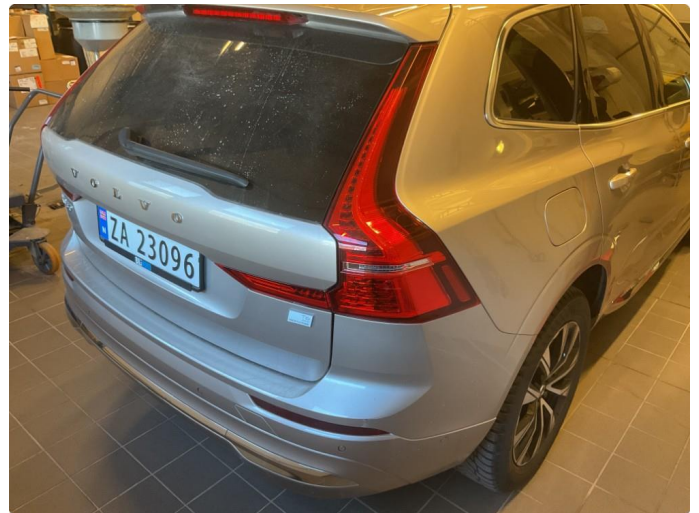
1.1 Generelt noe bruksmerker rundt om bilen. Fremstår som normal slitasje