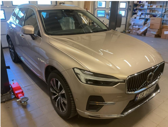
1.1 Generelt noe bruksmerker rundt om bilen. Fremstår som normal slitasje