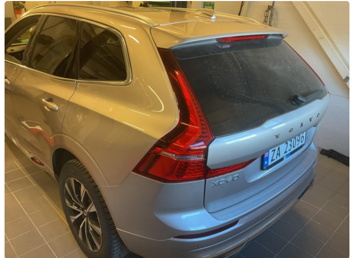
1.1 Generelt noe bruksmerker rundt om bilen. Fremstår som normal slitasje