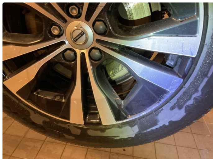
1.1 2 stk felger med merker på.