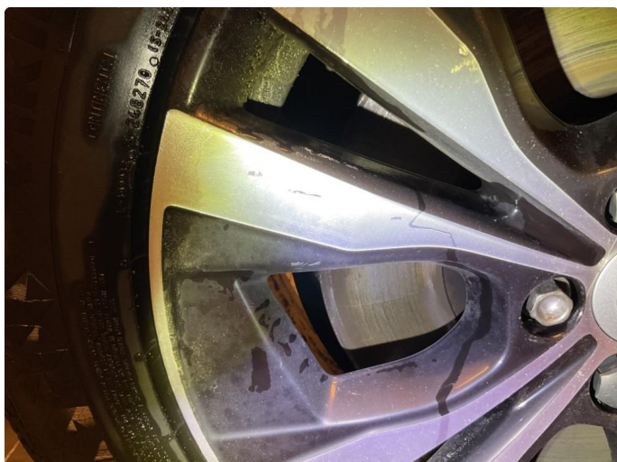
1.1 2 stk felger med merker på.