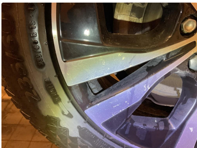
1.1 2 stk felger med merker på.