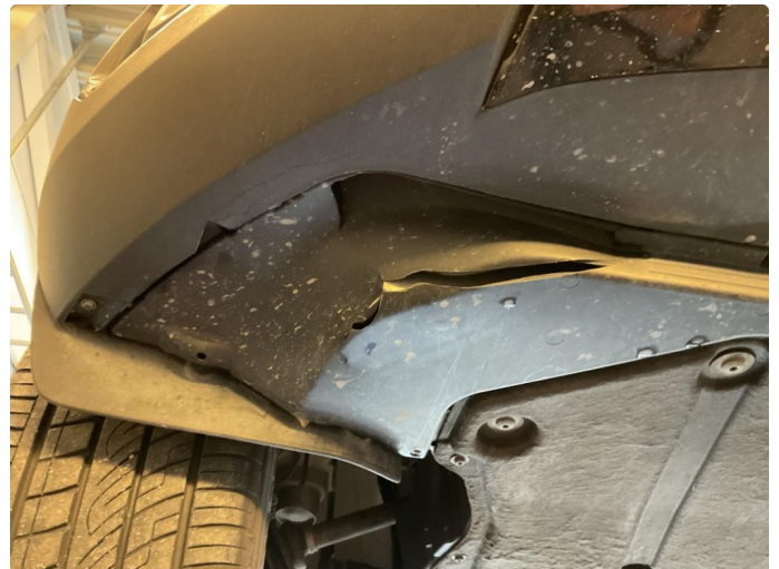
1.2 Beskyttelsesplate under er noe skadet. Har ingen betydning for bilens funksjon. Fremstår kun kosmetisk