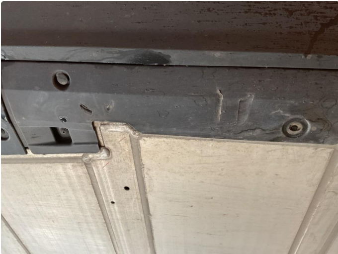
1.1 Beskyttelsesplate under er noe skadet. Har ingen betydning for bilens funksjon. Fremstår kun kosmetisk