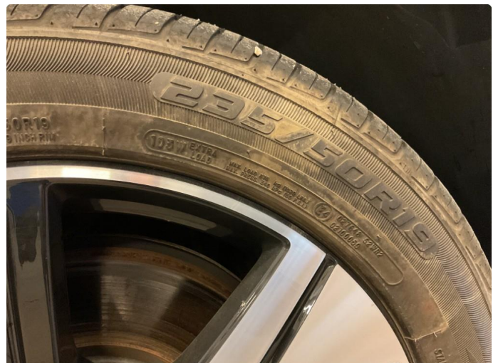
1.3 Merke på felg venstre foran