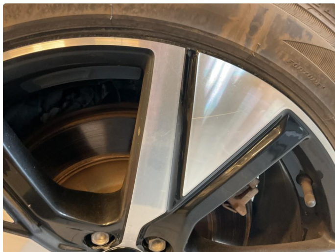
1.4 Merke på sommerfelg venstre bak