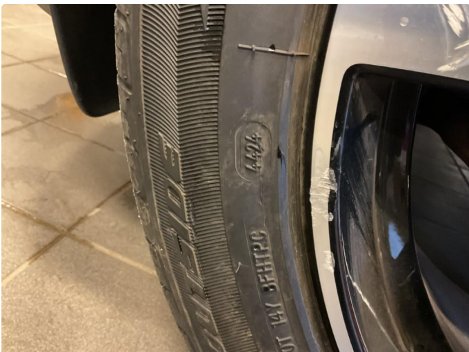
1.3 Merke på felg venstre foran