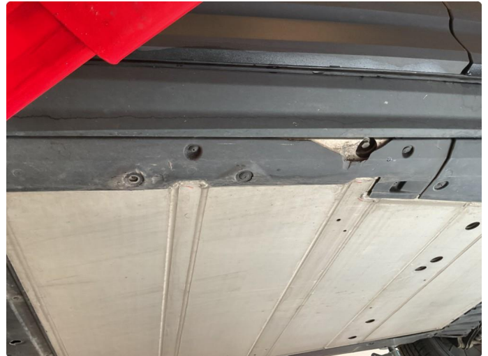
1.1 Beskyttelsesplate under er noe skadet. Har ingen betydning for bilens funksjon. Fremstår kun kosmetisk