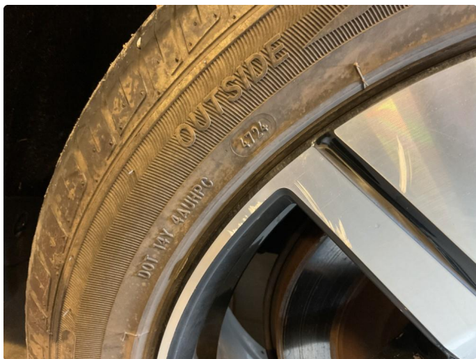
1.4 Merke på sommerfelg venstre bak