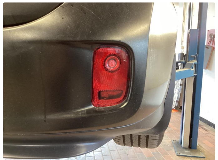
2.1 Krakelering i plast