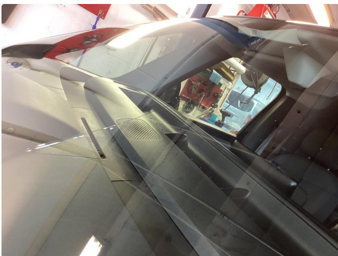
1.5 Steinsprut med sprekk