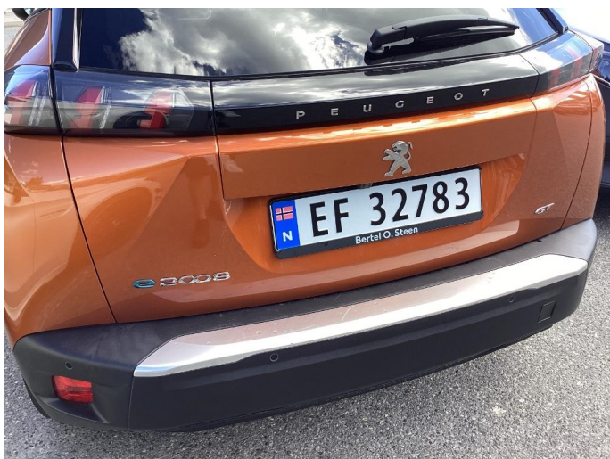
1.4 Lister skadet/mangler