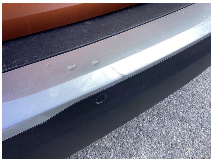
1.4 Lister skadet/mangler