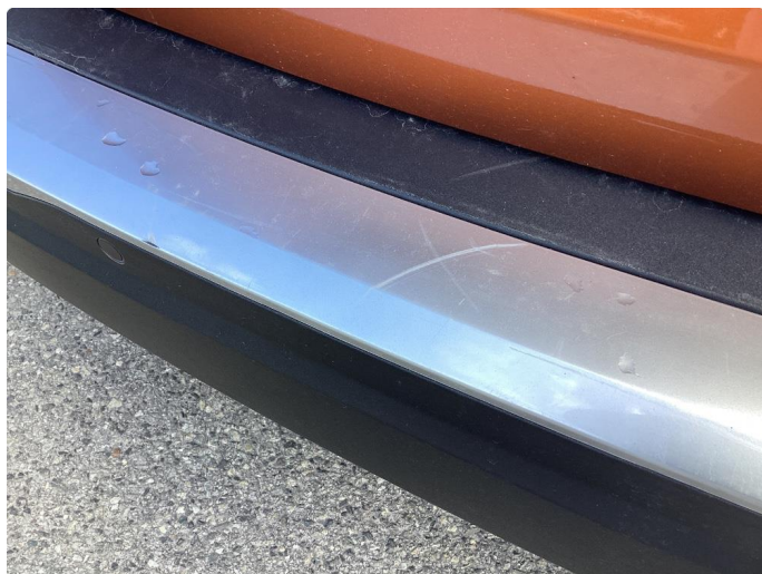
1.4 Lister skadet/mangler