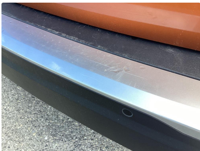
1.4 Lister skadet/mangler