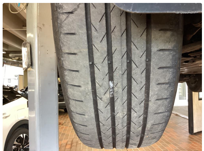
1.3 Skjev slitasje på sommerdekk