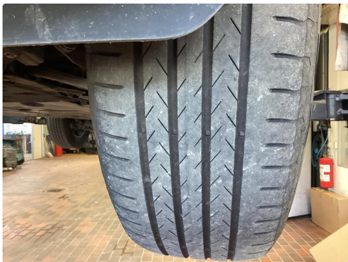
1.3 Skjev slitasje på sommerdekk