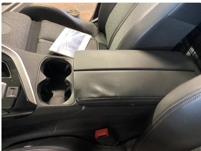
2.1 Slitt trekk