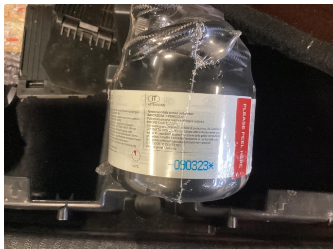
1.1 Dekkttettemiddel utgått/mangler