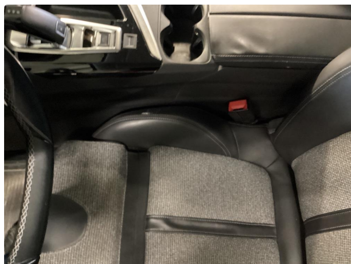
2.2 Skade på setepute