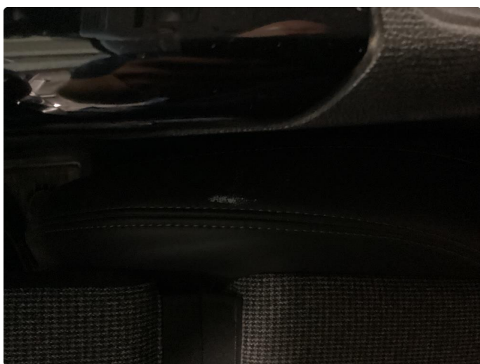
2.2 Skade på setepute