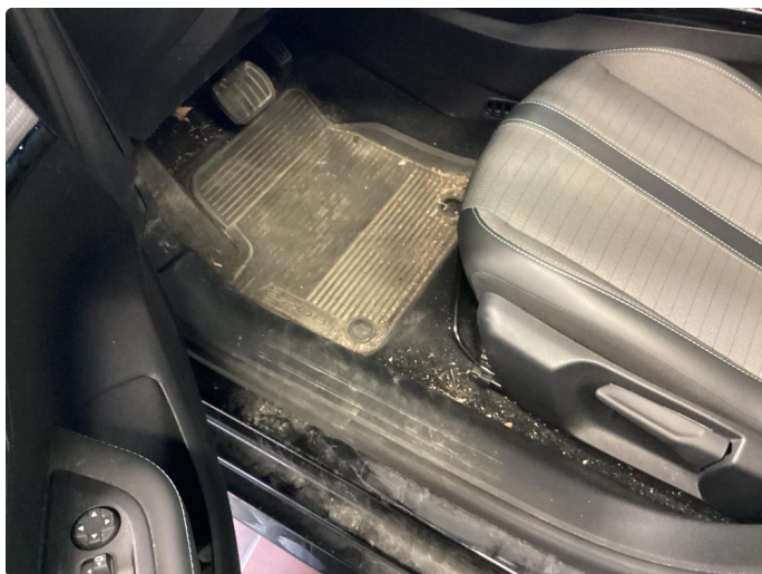
2.3 Innvendig vask