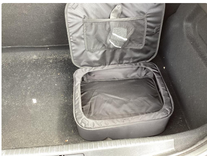
2.1 Ladekabel mangler