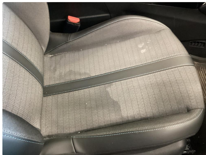
2.3 Innvendig vask