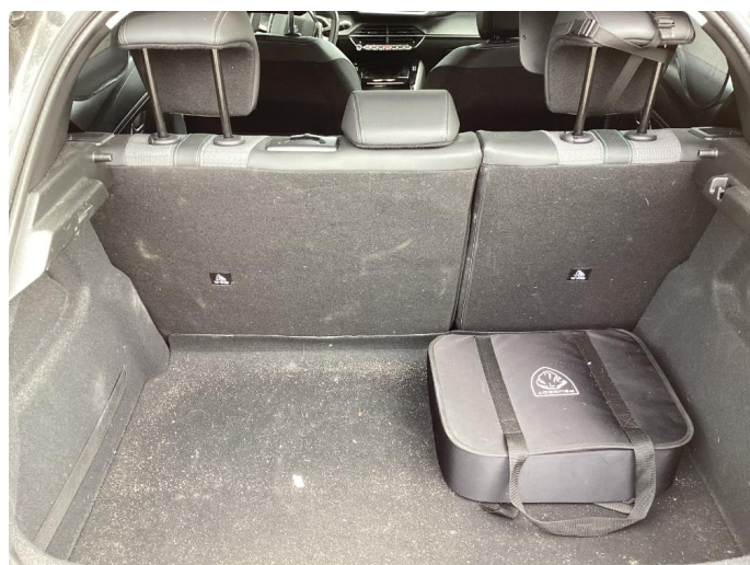
2.2 Øvrig opplysninger