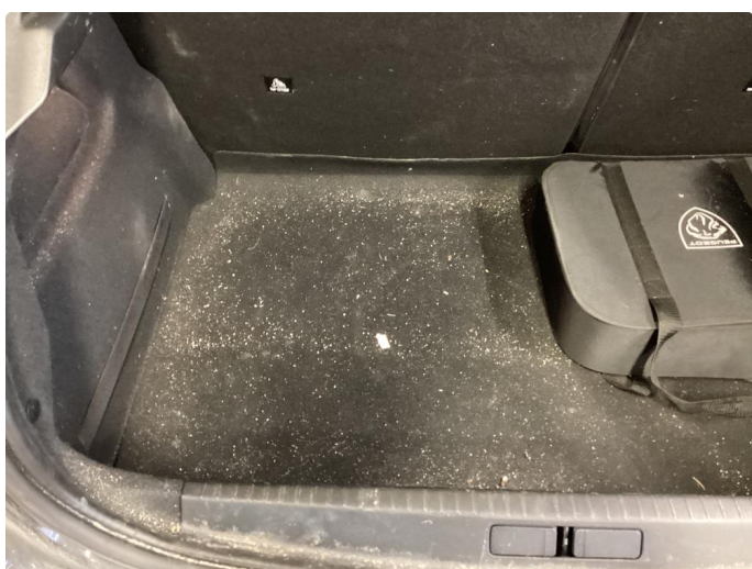
2.3 Innvendig vask