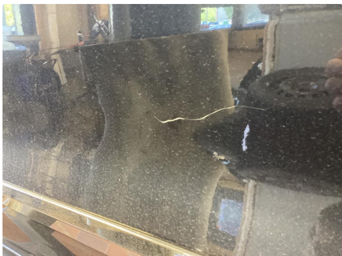
1.1 Ripe ned til grunning