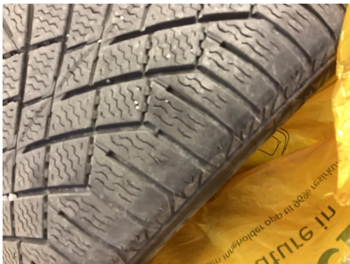
1.4 Skjev slitasje på vinterdekk