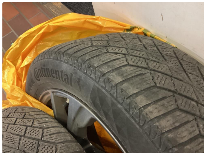
1.4 Skjev slitasje på vinterdekk