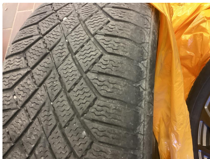
1.4 Skjev slitasje på vinterdekk