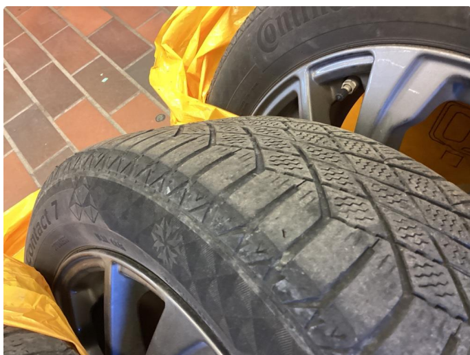
1.4 Skjev slitasje på vinterdekk