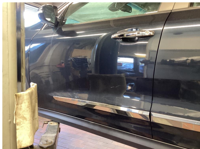
1.1 Ripe ned til grunning