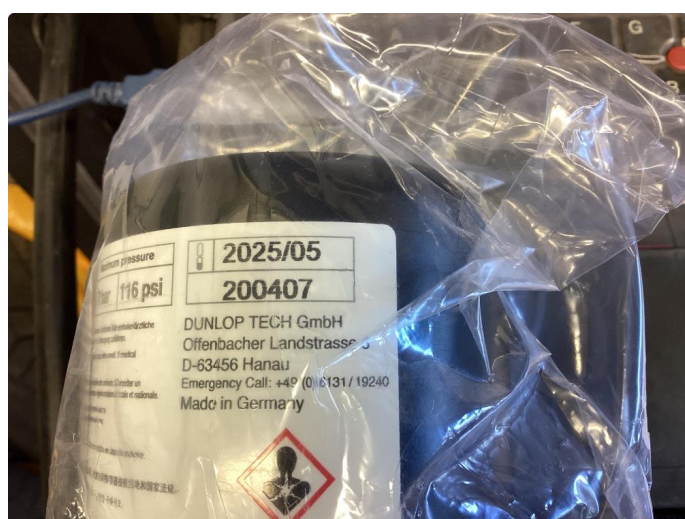
1.3 Dekktemiddel utgått/mangler