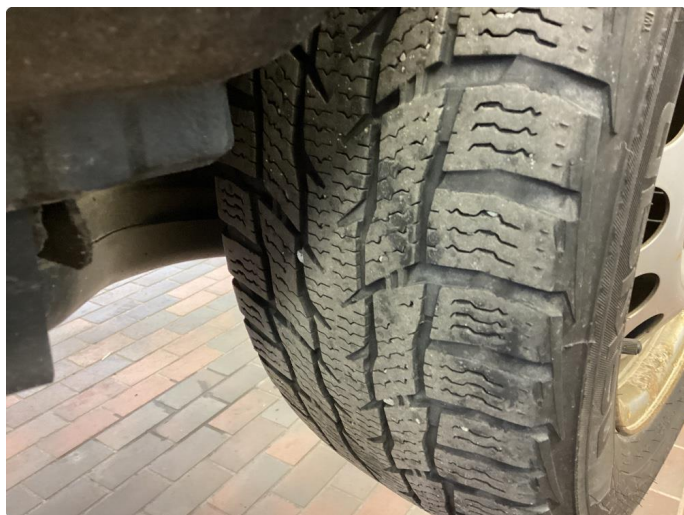
1.3 Skjev slitasje på vinterdekk