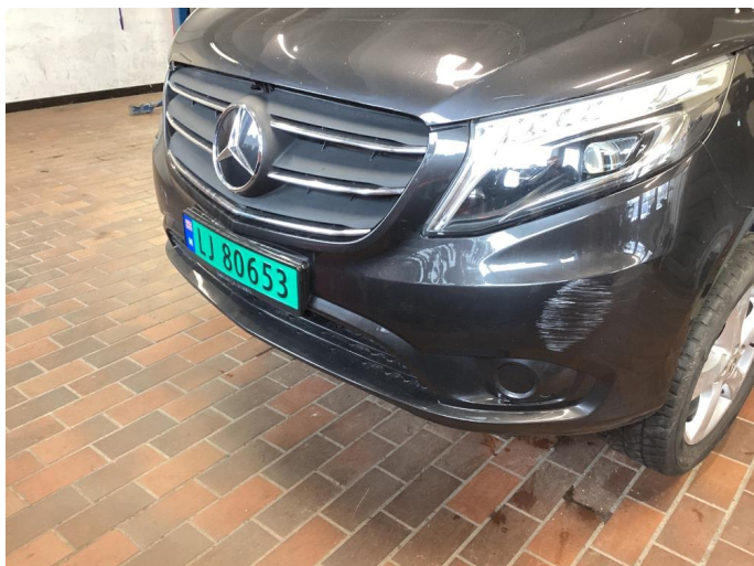
1.4 Ripe(r) ned til grunning