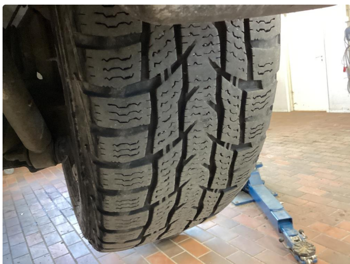
1.3 Skjev slitasje på vinterdekk