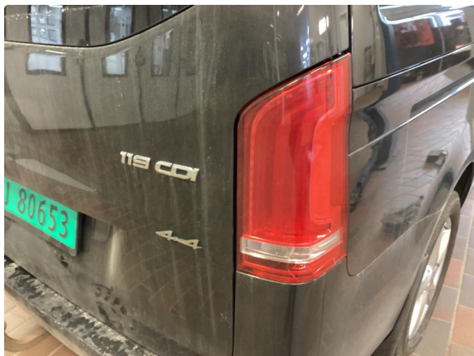
2.1 Defekt / sprukket glass