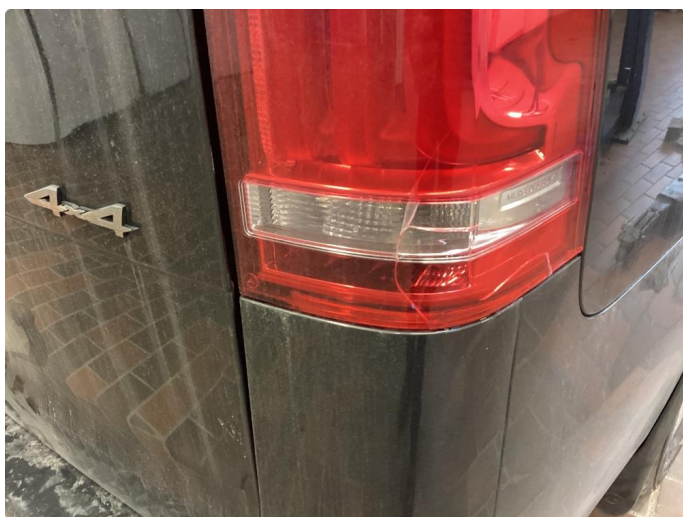
2.1 Defekt / sprukket glass