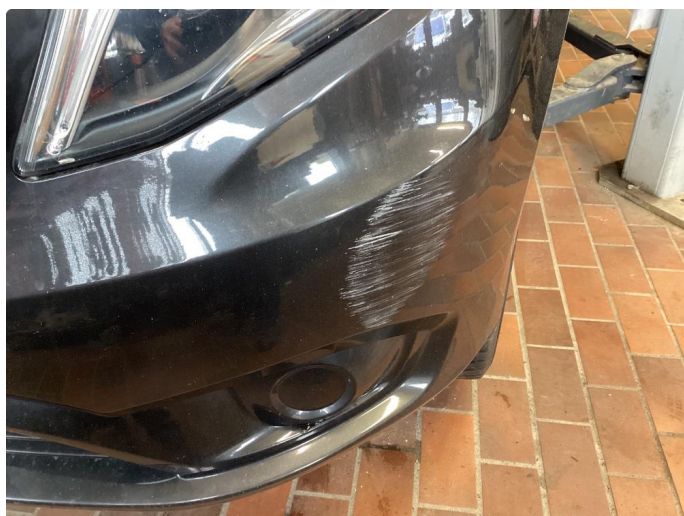
1.4 Ripe(r) ned til grunning