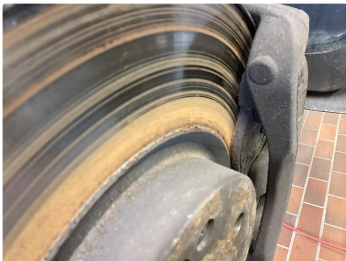
4.1 Utslitte skiver og klosser