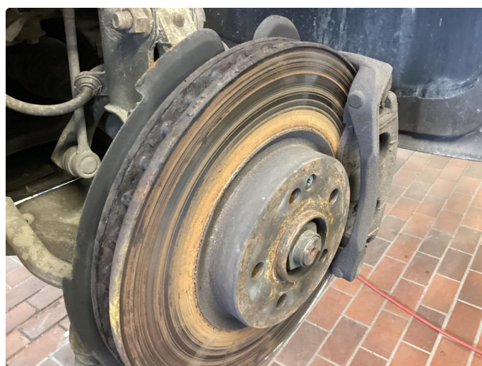
4.1 Utslitte skiver og klosser