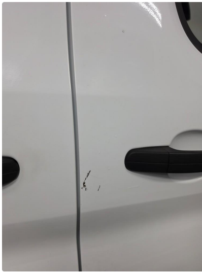
1.1 Noen riper og bruksmerker