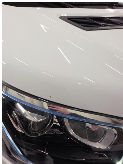
1.1 Noen riper og bruksmerker