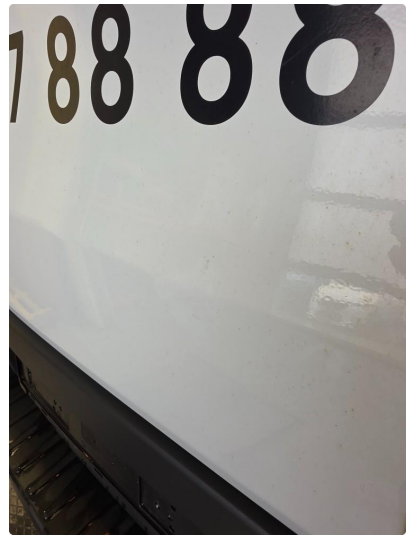
1.1 Noen riper og bruksmerker