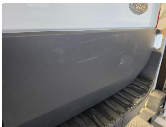
1.1 Noen riper og bruksmerker