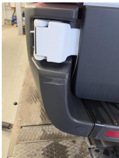
1.1 Noen riper og bruksmerker