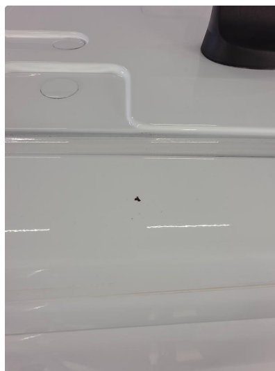
1.1 Noen riper og bruksmerker