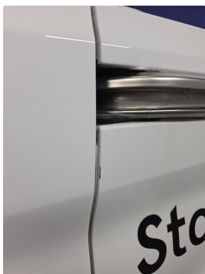
1.1 Noen riper og bruksmerker