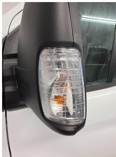
1.1 Noen riper og bruksmerker