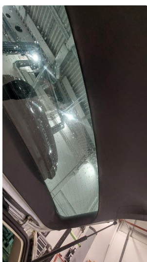
2.1 Bakluketrekk ripe(r)