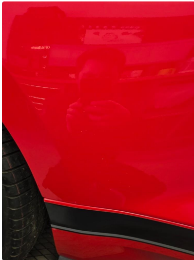
1.1 Liten steinsprut