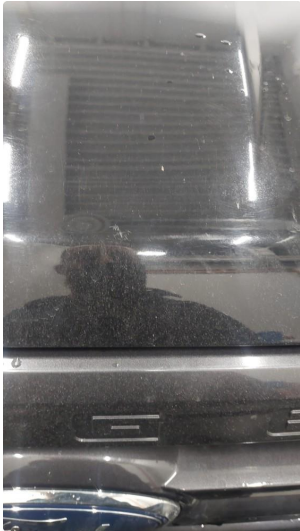
1.1 Generelt noen riper/bruksmerker