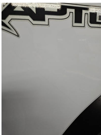
1.1 Noen bruksmerker