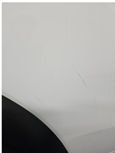
1.1 Noen bruksmerker