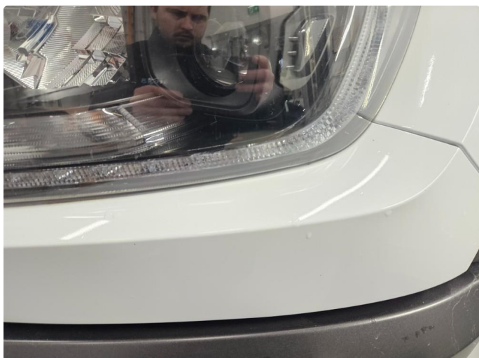
1.1 Noen bruksmerker