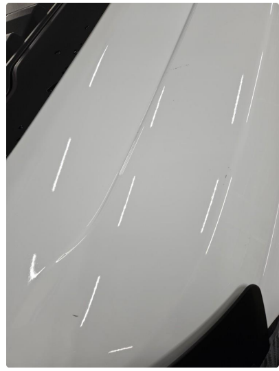
1.1 Noen bruksmerker