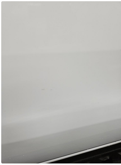
1.1 Noen bruksmerker