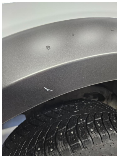
1.1 Noen bruksmerker