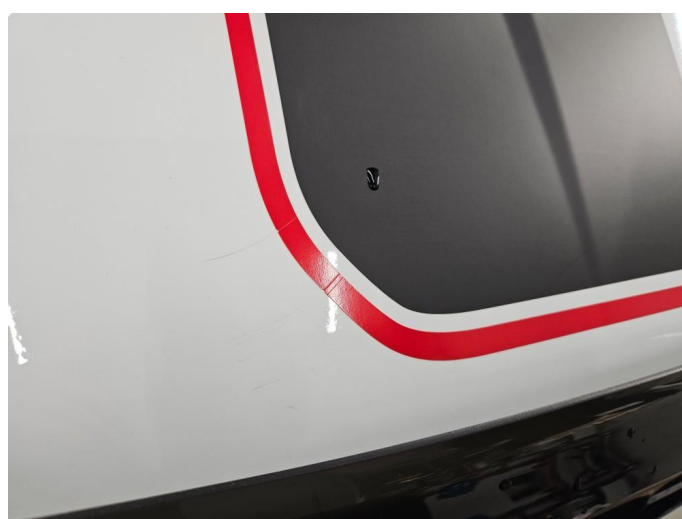
1.1 Noen bruksmerker