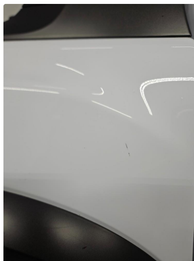
1.1 Noen bruksmerker