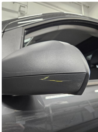
1.2 Speilhus skadet