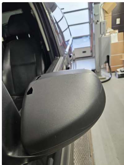
1.2 Speilhus skadet