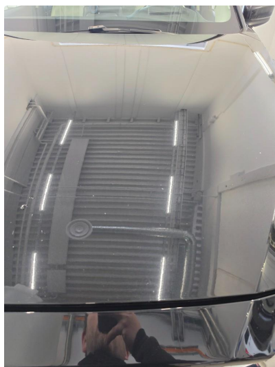
1.1 Noen steinsprut