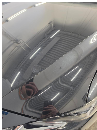
1.1 Noen steinsprut