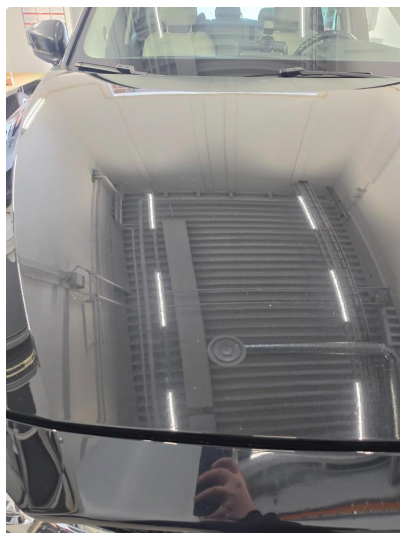
1.1 Noen steinsprut