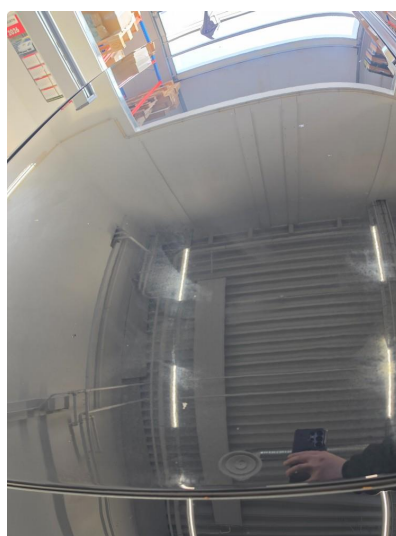
1.3 Noen få steinsprut