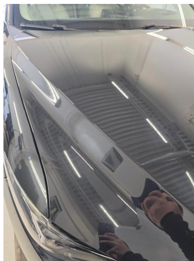
1.1 Noen steinsprut