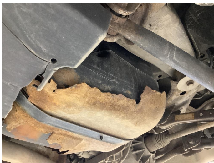
1.2 Beskyttelsesplate skadet/mangler