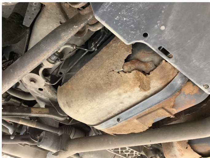
1.2 Beskyttelsesplate skadet/mangler