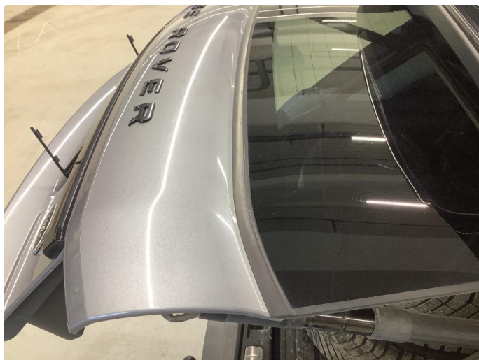
1.3 Skadede lister