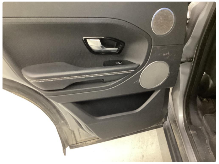
3.1 Skadet/merker etter utstyr