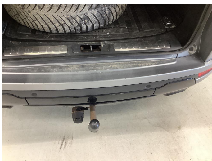
1.1 Generell bruksslitasje - normalt for år/km