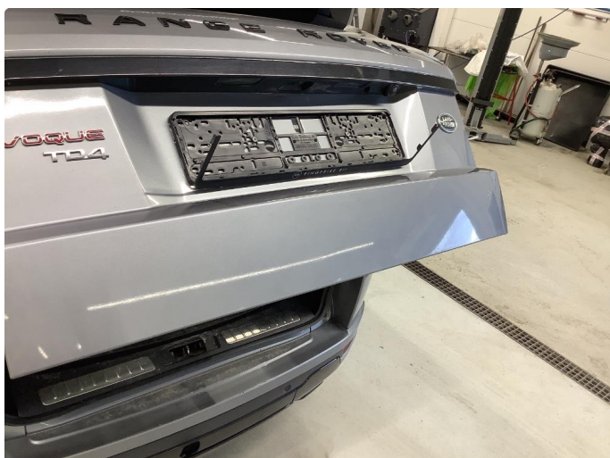
1.1 Generell bruksslitasje - normalt for år/km