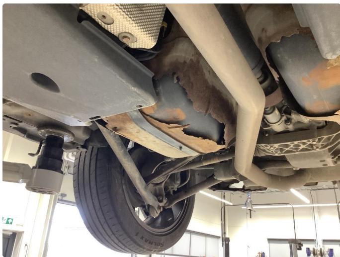
1.2 Beskyttelsesplate skadet/mangler