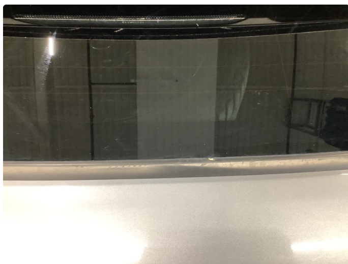
1.3 Skadede lister