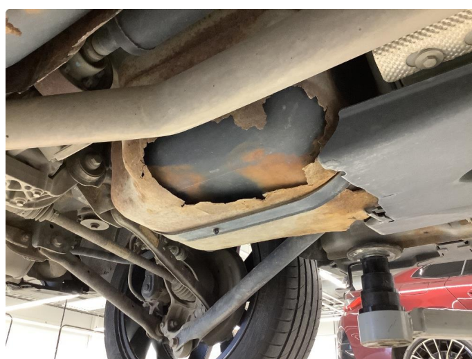
1.2 Beskyttelsesplate skadet/mangler