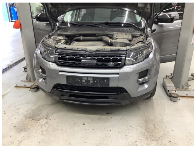
1.1 Generell bruksslitasje - normalt for år/km