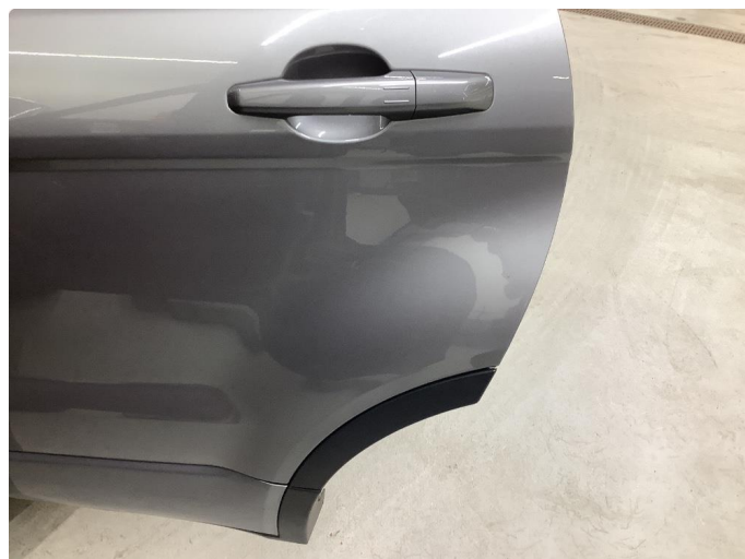
1.1 Generell bruksslitasje - normalt for år/km