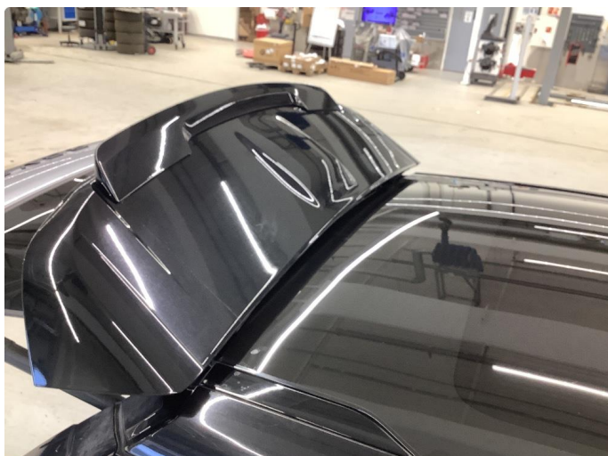
1.1 Generell bruksslitasje - normalt for år/km