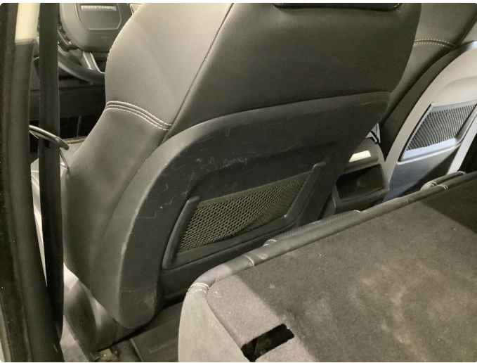
3.2 Skade på seterygg