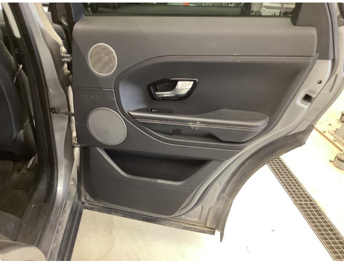
3.1 Skadet/merker etter utstyr