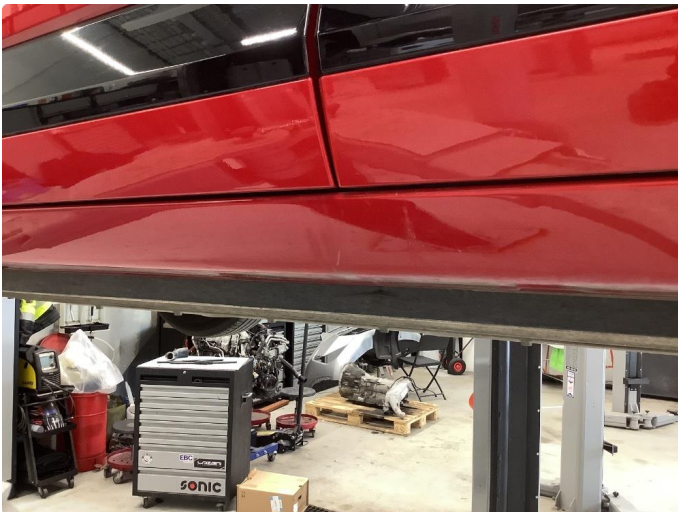
1.2 Matt/slitt lakk - normal bruksslitasje