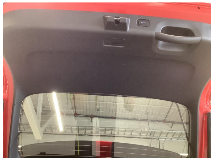
2.2 Ripe(r) - normal bruksslitasje