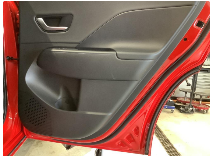
2.1 Skadet/merker etter utstyr - normal bruksslitasje