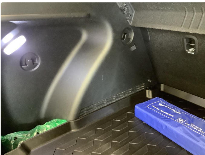
2.2 Ripe(r) - normal bruksslitasje