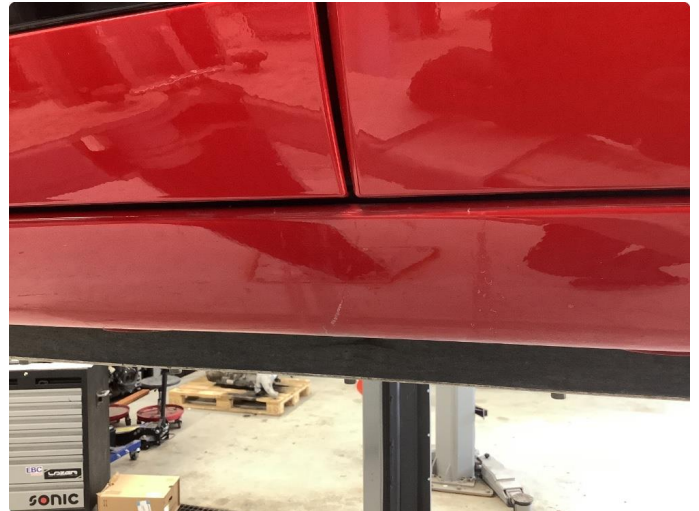
1.1 Ripe(r) - normal bruksslitasje