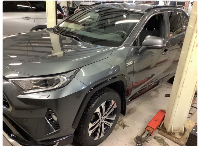
1.1 Generell bruksslitasje - dette er normalt i henhold til bilens alder og kilometerstand