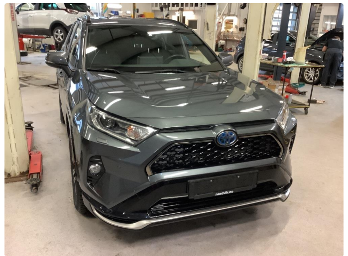
1.1 Generell bruksslitasje - dette er normalt i henhold til bilens alder og kilometerstand