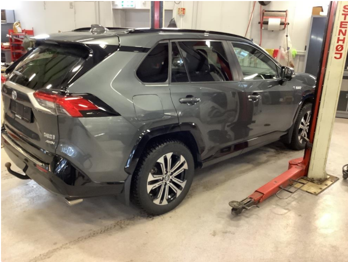
1.1 Generell bruksslitasje - dette er normalt i henhold til bilens alder og kilometerstand