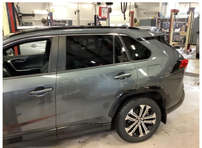
1.1 Generell bruksslitasje - dette er normalt i henhold til bilens alder og kilometerstand