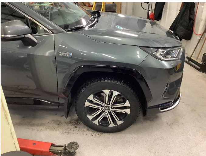
1.1 Generell bruksslitasje - dette er normalt i henhold til bilens alder og kilometerstand