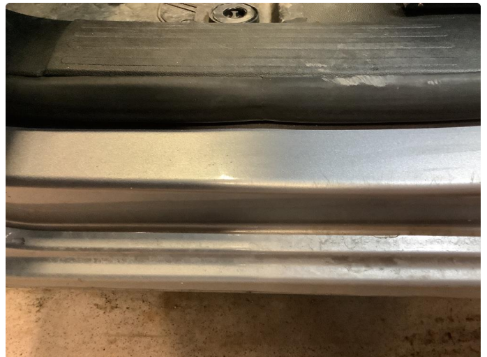
1.1 Slitt gjennom lakk