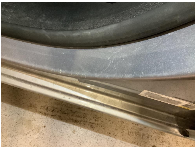
1.1 Slitt gjennom lakk