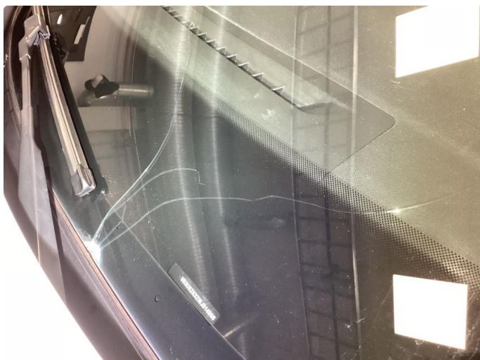
1.1 Sprekk i frontrute, skiftes før levering ny eier.