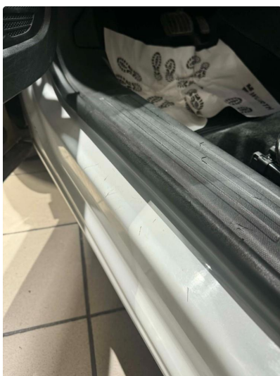
1.2 Noe mindre slitasje i innsteg til førsete. Normalt iht alder og km