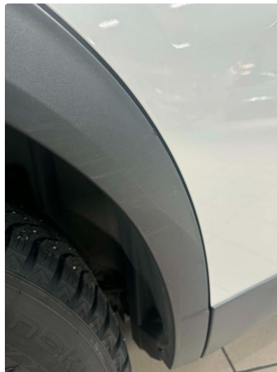
1.1 Lett slitasje på lakk - Fin i lakk i henhold til alder og km