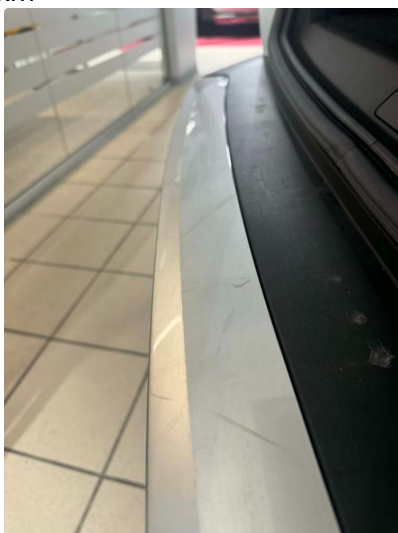
1.1 Lett slitasje på lakk - Fin i lakk i henhold til alder og km