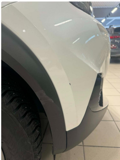
1.1 Lett slitasje på lakk - Fin i lakk i henhold til alder og km