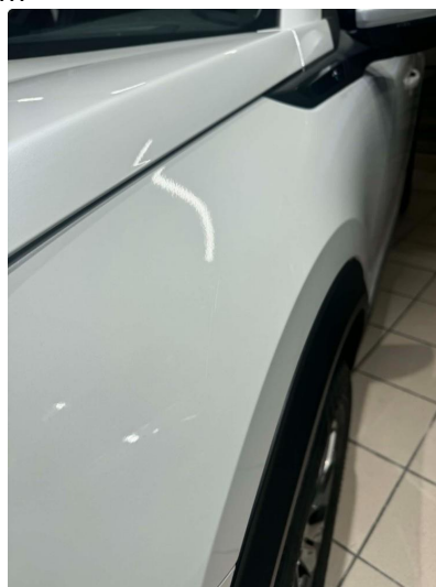
1.1 Lett slitasje på lakk - Fin i lakk i henhold til alder og km