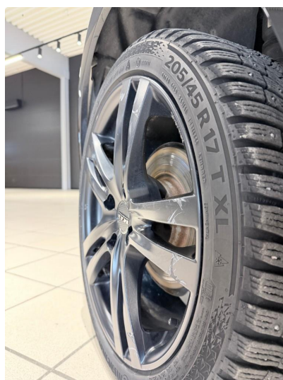
2.2 Noe merker i felger.