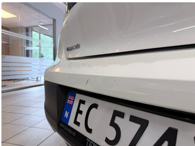
1.1 Lite merke i fanger bak