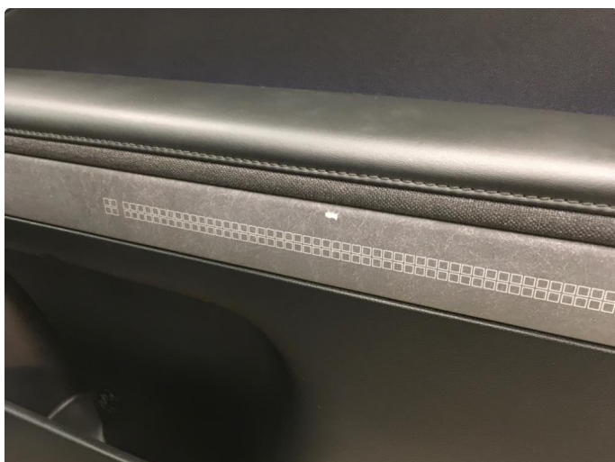
3.1 List skadet