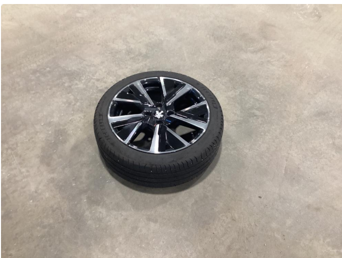
1.3 Hjulsett mangler - sommer