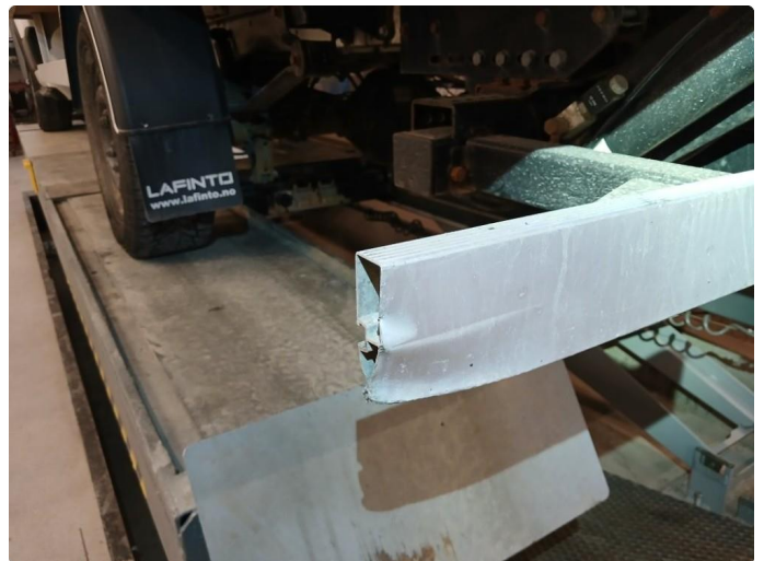
1.5 Merker på lister begge sider bak