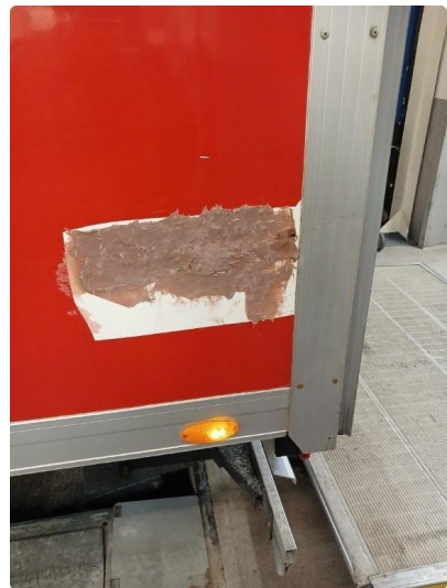
1.4 Riper på skap, merke på bakluke og side