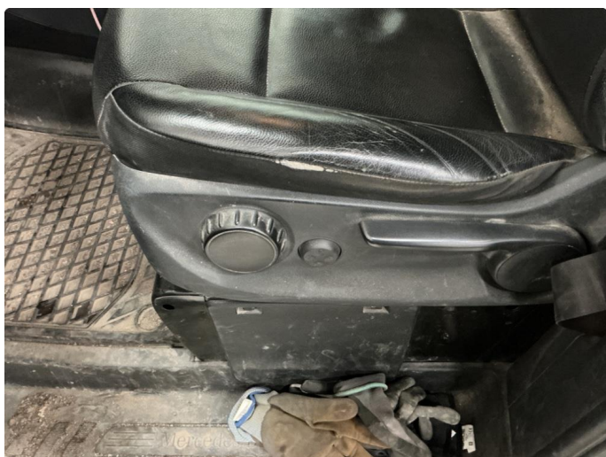
2.1 Skade på setepute