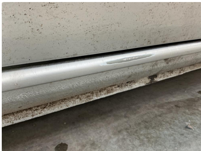
1.5 Lakk flasser