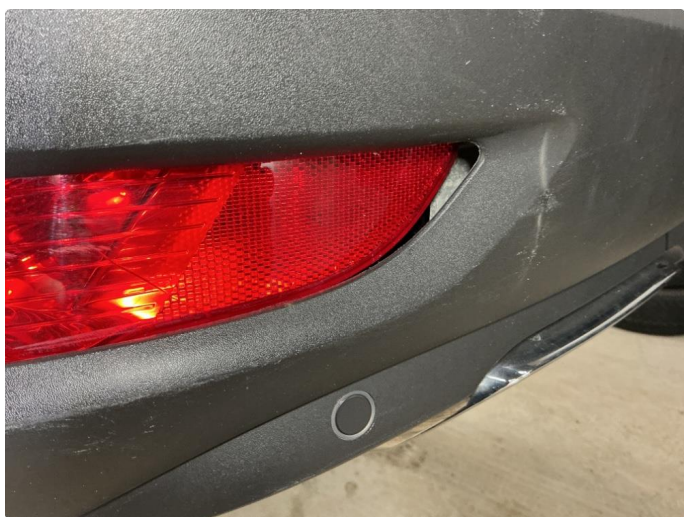
1.4 Liten skade i plasten