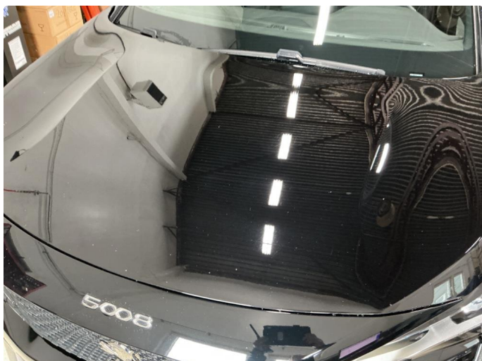
1.1 Noe steinsprut på panser