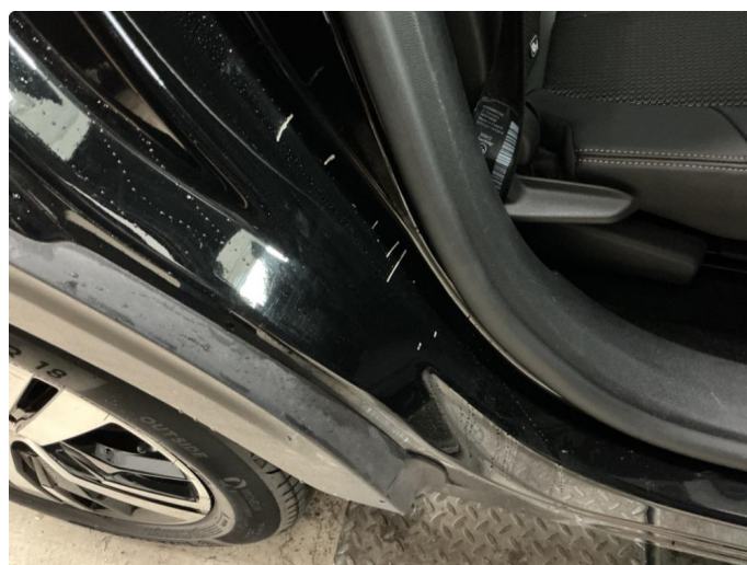
1.3 Riper på innsiden av døren