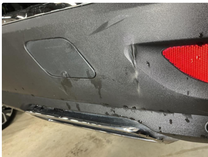
1.4 Liten skade i plasten