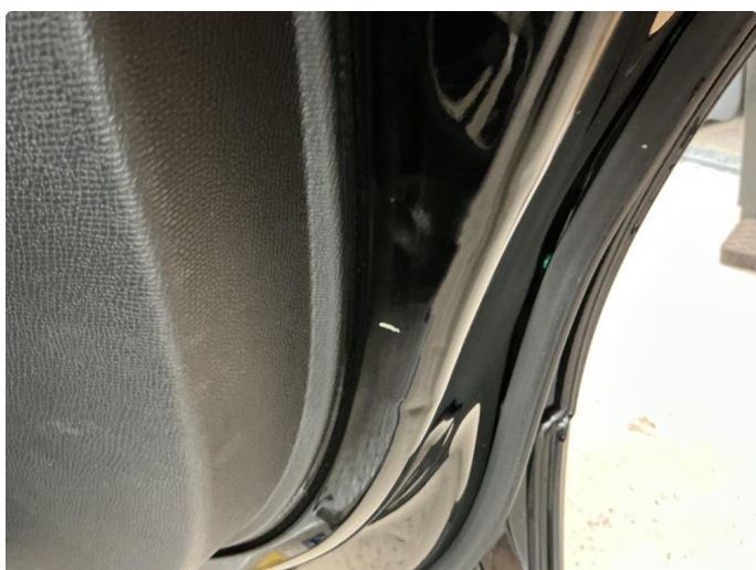
1.3 Riper på innsiden av døren