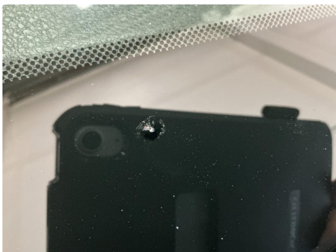
1.2 Steinsprut med sprekk utenfor synsfelt