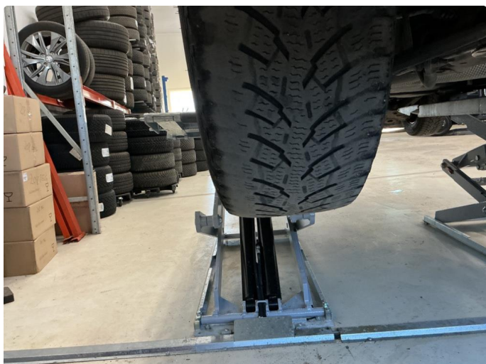
1.1 For liten mønsterdybde vinterdekk