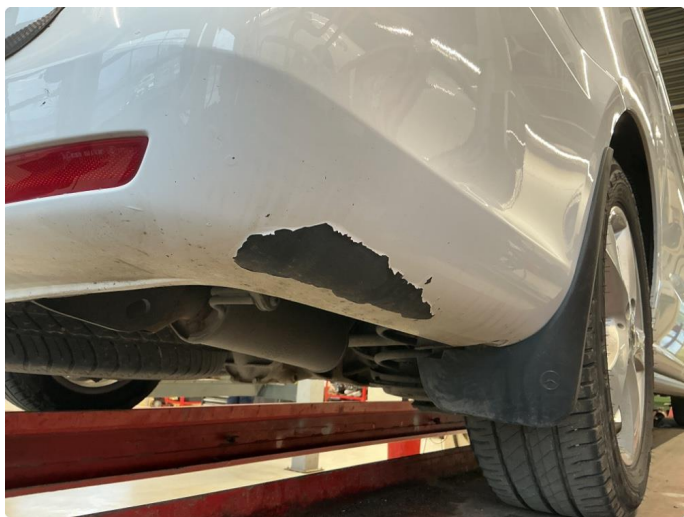
1.5 Lakk flasser