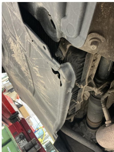
1.1 Beskyttelsesplate skadet