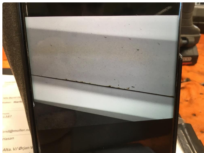
1.2 Noe merker venstre foran