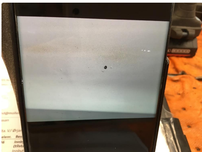
1.3 Noe merker venstre bak