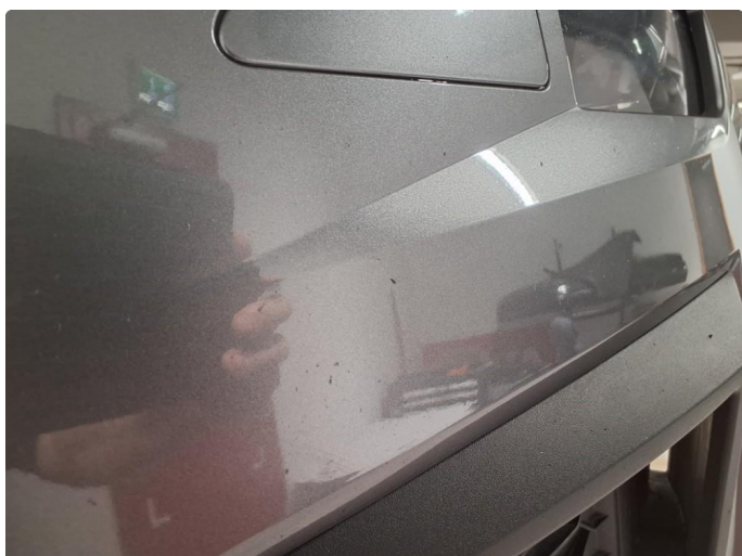
1.3 Noe steinsprut på frontfanger