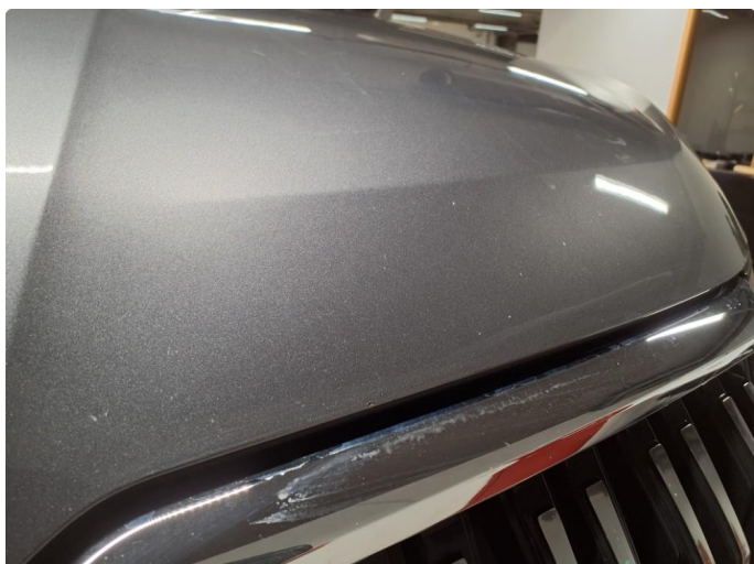
1.1 Noe steinsprut på panser