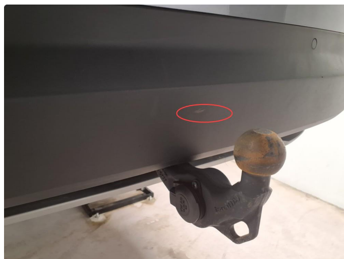
1.4 Lite merke i bakfanger