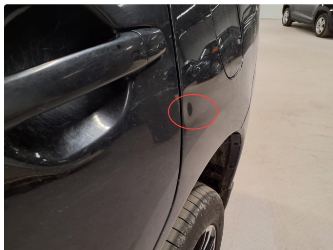
1.4 Bulk med lakkskade