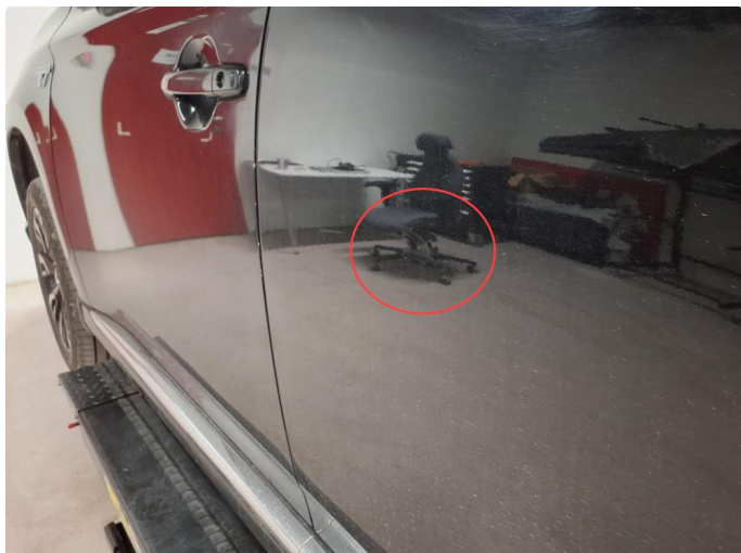
1.2 Liten bulk med lakkskade