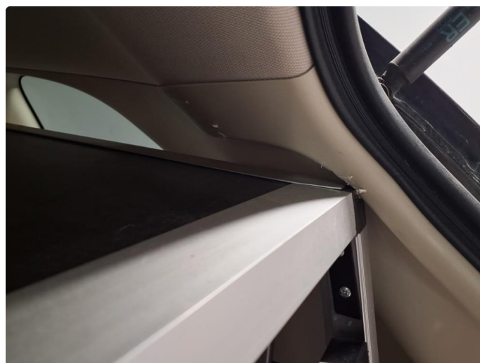
2.2 Merke på deksler i bagasjerom