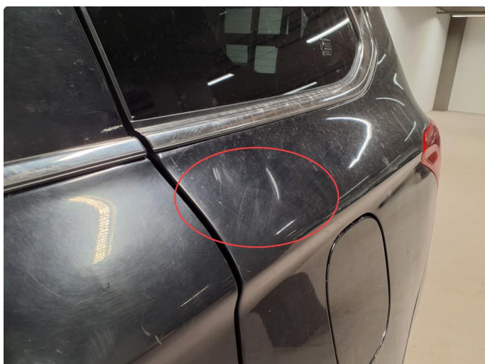
1.4 Bulk med lakkskade