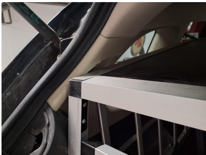
2.2 Merke på deksler i bagasjerom