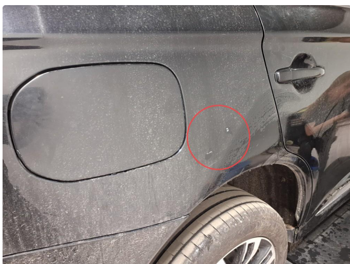
1.5 Liten bulk med lakkskade