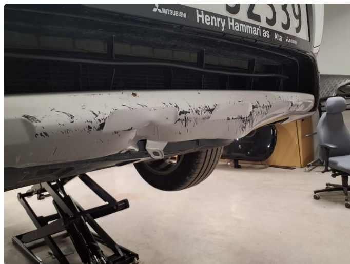
1.8 Slitasje og bulker nederste list på frontfanger