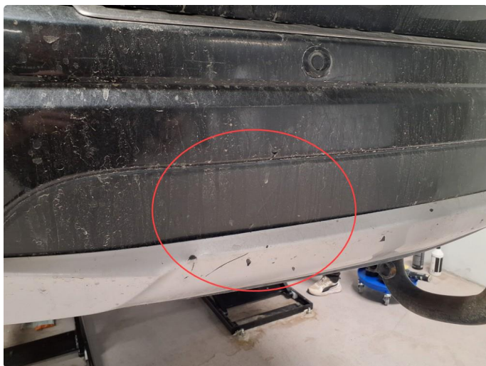
1.7 Noe merker på bakfanger