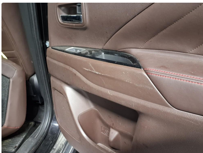
2.1 Merker på dørtrekk høyre side bak