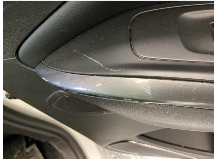
1.2 Noen bruksmerker på høyre dørtrekk