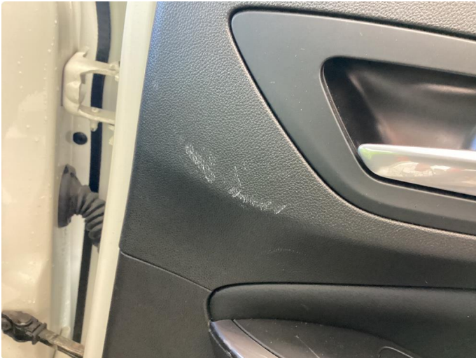
1.2 Noen bruksmerker på høyre dørtrekk